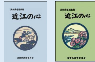
滋賀県道徳教材の活用